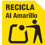
LÁMINA DE ALUMINIO